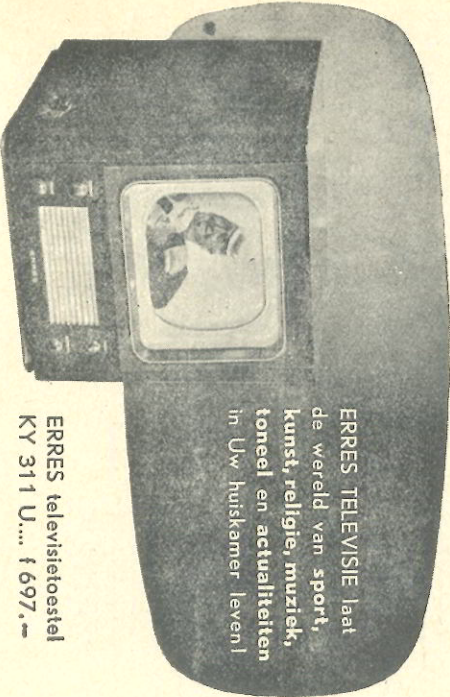
ERRES televisietoestel KY 311 U.... f 697,-

Al meer dan 25 jaar geldt: ERRIS MAARREËN ERRES!